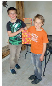
Ziehung der beiden Gewinner

(R) 214 Personen, Gross und Klein, nahmen am Wettbewerb der EDU Ortspartei an der Gewerbeausstellung teil. Die Fragen streiften Kernthemen der EDU, testeten das Wissen über unser Dorf und einige gesellschaftspolitische Themen. 152 Personen warfen richtige Antworten in die Wettbewerbsurne ein. Als 1. Preis winkt ein Gutschein der EDU für das Restaurant Linde in Wängi.