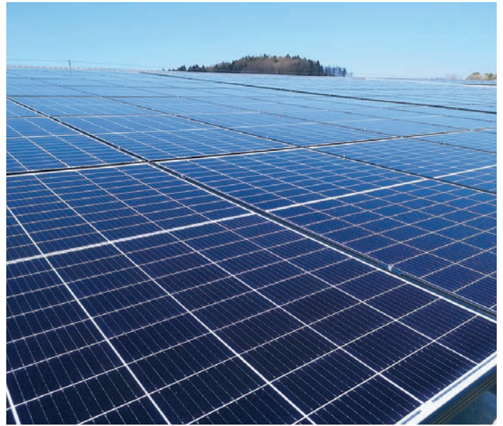
Diese Anlage von THURGIE Solar hat 72 Miteigentümerinnen und Miteigentümer: Reithalle Friedau Aadorf.

So einfach funktioniert das Modell: Private und Firmen buchen die gewünschte Anzahl Quadratmeter Solarpanel (ab 1 m 2 ) und erhalten die entsprechende Menge Solarstrom während der Vertragsdauer von maximal 20 Jahren geliefert. Das Angebot richtet sich an alle, die keine eigene Solaranlage bauen wollen oder können. Das sind unter anderen Mietende, Liegenschaftsbesitzende oder Stockwerkseigentümerinnen und -eigentümer. In der jährlichen Stromabrechnung wird der Solarstrom jeweils gutgeschrieben. Ohne eine eigene Solaranlage betreiben zu müssen, gelangen die Kundinnen und Kunden mit diesem Beteiligungsmodell zuverlässig zu nachhaltiger Energie – und dies ohne finanzielles Risiko, denn THURGIE baut und unterhält die Anlagen.