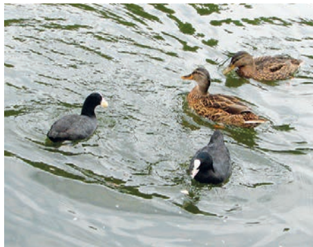
Enten und Blässhühner (Foto Ruedi Götz)

Die Fütterung von Wasservögeln ist jedoch unnötig, erst recht in den Sommermonaten, in welchen die Vögel auf, unter und neben dem Wasser genügend natürliche Nahrung finden. Grosse Brotmengen können zu Verdauungsproblemen führen, erst recht, wenn schimmeliges Brot, oder gewürzte Essensreste verfüttert werden.