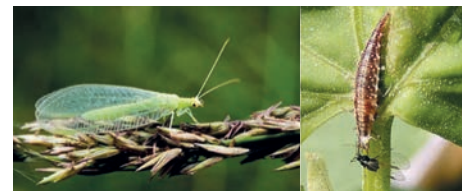
Florfliege und Florfliegenlarve

bringen! Viele Marienkäferarten fressen Blattläuse. Allein die Nachkommen eines einzigen Siebenpunkt-Marienkäfers können während des Sommers rund 100 000 Läuse vertilgen. Auch die Larven der Florfliege und der Schwebfliege fressen mit grossem Appetit Blattläuse. Auf ihrem Speisezettel haben sie auch weitere Blattsauger. Schwebfliegen sind zudem Pollensammler, die nicht nur für die Bestäubung zuständig sind, sondern auch Frassinsekten abschrecken.