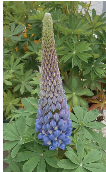
Vielblättrige Lupine Lupinus polyphyllus