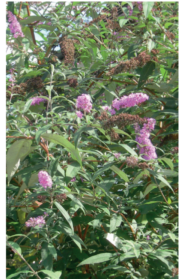
Sommerflieder Buddleja davidii