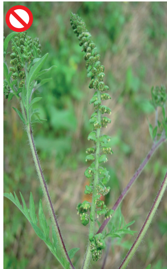
Ambrosia Ambrosia artemisiifolia