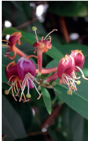
Asiatische Geissblättern Lonicera henryi Lonicera japonica