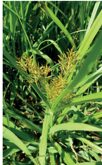
Erdmandelgras Cyperus esculentus