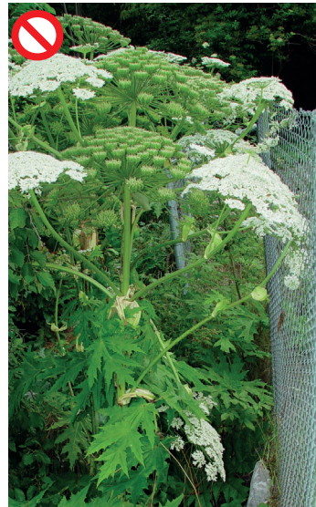
Riesenhärenklau Heracleum mantegazzianum