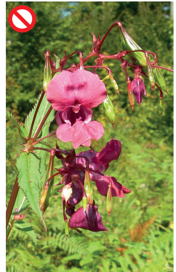
Drüsiges Springkraut Impatiens glandulifera