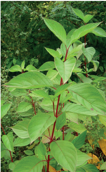
Seidiger Hornstrauch Cornus sericea