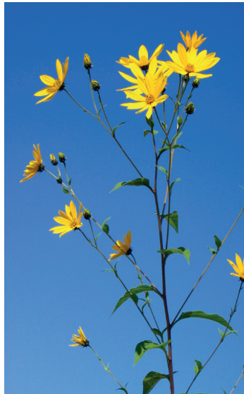
Topinambur Helianthus tuberosus