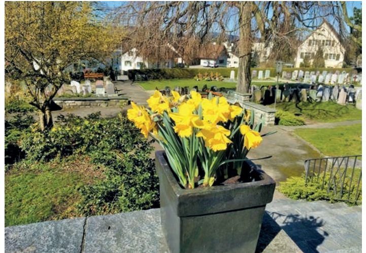
Frühlingserwachen in Wängi

Die Eskalation von Karfreitag war nicht das Ende. Die ersten Zeugen des neuen Lebens waren Frauen.