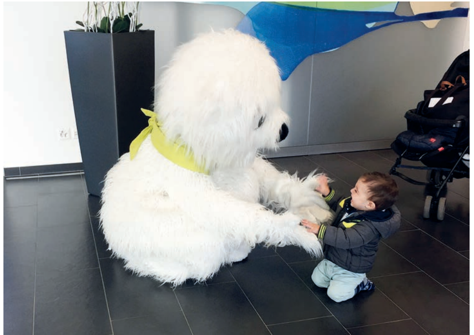
TKB-Maskottchen Eisbär Carlo gratuliert einem fleissigen Sparer am Kässeli-Leertag.

Kürzlich fand bei der Thurgauer Kantonalbank (TKB) Wängi der Kässeli-Leertag statt. Bereits zum zweiten Mal empfing Eisbär Carlo, Maskottchen der Bank und Namensgeber des TKB-Clubs für Kundinnen und Kunden bis zwölf Jahre, die jungen Gäste in der Geschäftsstelle