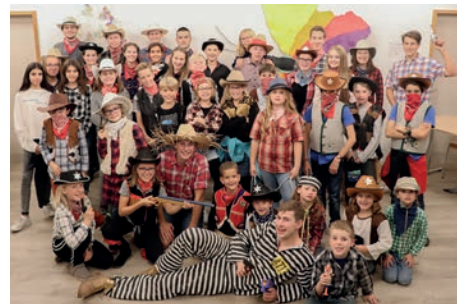
dazu jede Menge Snacks für zwischendurch. Leiterteam JW/BR

gelangen, wenn sie einmal alles beim Spielen verloren hatten. Es gab auch einige Spieler, die versuchten zu betrügen, doch der Sheriff sorgte für Ruhe und Ordnung. Damit die Gäste nicht verdursteten, gab es an der Bar im Saloon diverse Sips und Süssgetränke im Angebot und