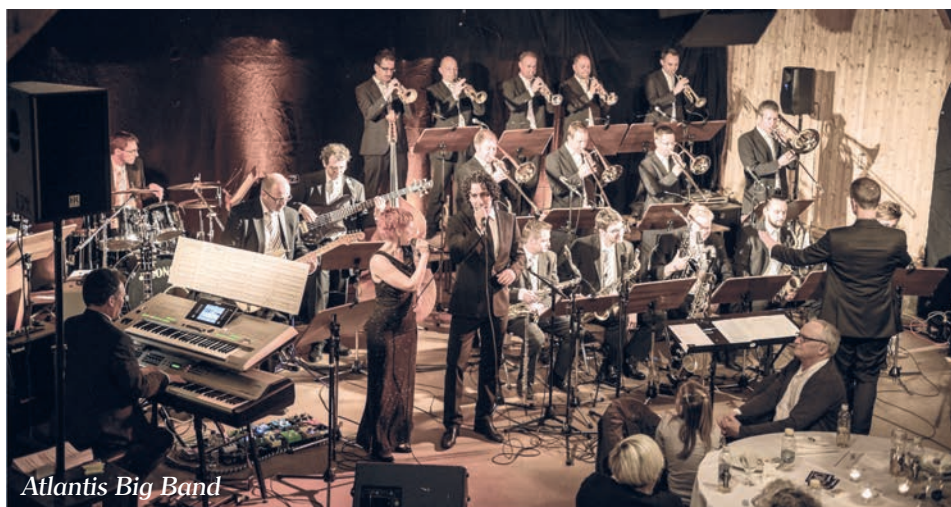
Atlantis Big Band

Als grosses Highlight findet zwischen den beiden Auftritten, um 22.30 Uhr, ein grosses Feuerwerk statt.